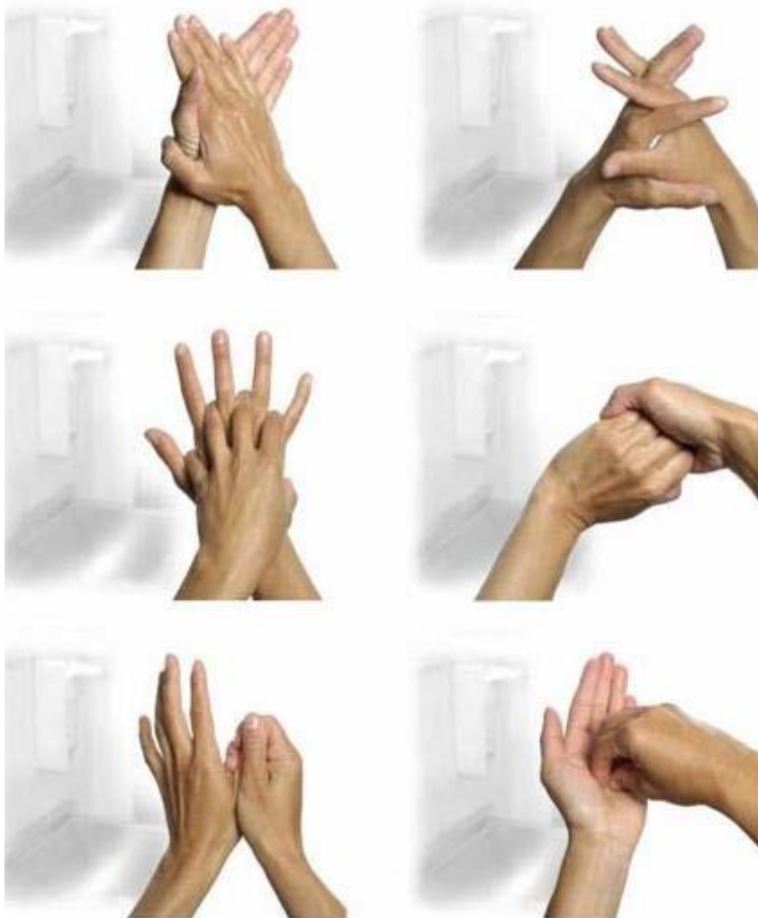
AFBEELDING 4.2 Techniek om alle onderdelen van de handen te bereiken bij handdesinfectie en handen wassen.

Bron: Foto's zijn gemaakt en ter beschikking gesteld door A. Widmer, Basel, Zwitserland. Uit WIP-richtlijn Handhygiëne medewerkers (ziekenhuizen).